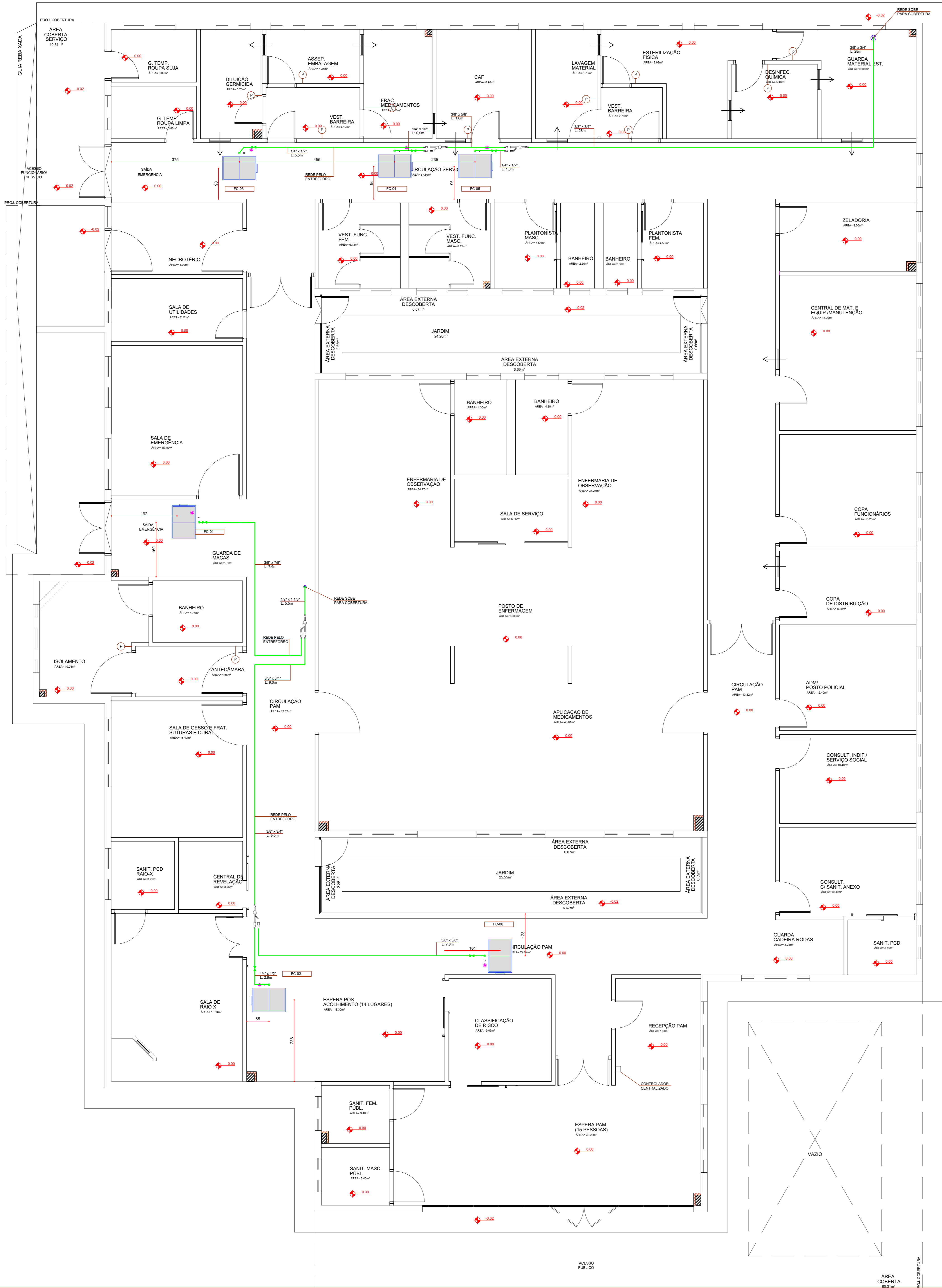
PLANTA PAVIMENTO TÉRREO - REDE FIGORIGENA ESCALA 1 : 30